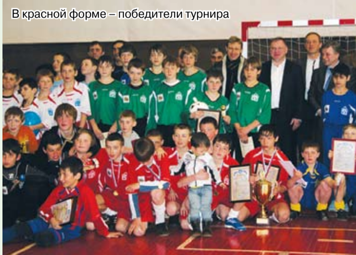
В красной форме – победители турнира