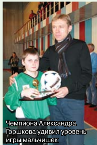
Чемпиона Александра Горшкова удивил уровень игры мальчишек

В финальном поединке сошлись команды школ № 512 и № 641. На трибунах «яблоку было негде упасть». Первый гол не заставил себя долго ждать – на 4-й минуте игры футболисты школы № 512 «распечатали» ворота соперников. Однако через две минуты счет сравнялся. Во втором тайме команда школы № 512 вновь вырвалась вперед и уже не дала соперникам шанса на победу. В итоге – 4:2.