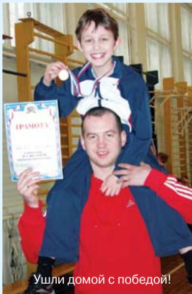
Ушли домой с победой!